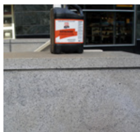
Resultado después de dejar FPFO durante una noche. Necesita una aplicación más

Esto mantendrá el producto más húmedo por más tiempo, así como evitar que alguien se manche con el producto aplicado.