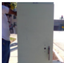
Limpiar con un paño húmedo