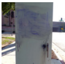
Aplicar FPFO en la mancha