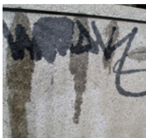
Tinta sobre granito abujardado

En hormigón, ladrillo o superficies porosas, etc., puede ser necesario dejar FPFO durante la noche. Al hacer esto, le sugerimos aplicar FPFO lo más denso posible y cubrirlo con plástico negro. Después precintando todos los bordes del plástico.