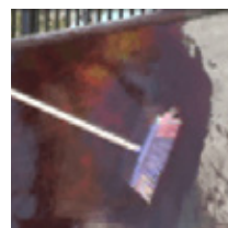
Inundar 3 capas de BBSM