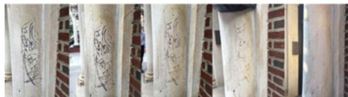
Rotulador permanente Sharpie en mármol histórico