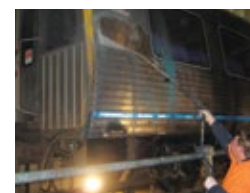
TRANSGEL se utiliza para quitar el graffiti viejo, más grueso, de los trenes.